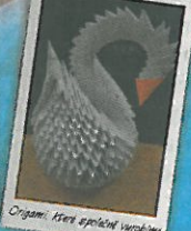
Origami, křehké společné výrobky