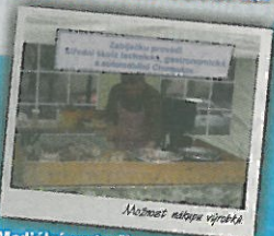
Mozbary, náboje, výpršky