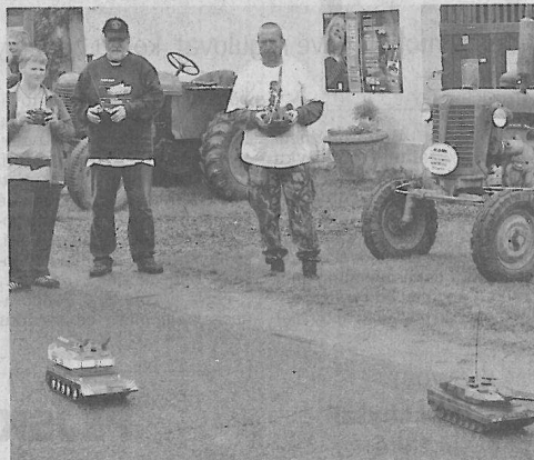
Návštěvníci u statku Pohoda ve Skupicích zaujaly také modely tanků a speciální techniky.

Akci připravilo občanského sdružení Stopy, o.s. spolu se Základní uměleckou školou Louny a společností Hydroclar, s.r.o. a finančně ji podpořil Ústecký kraj a město Louny.