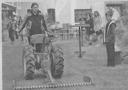
Nechyběla vystavená zemědělská technika.