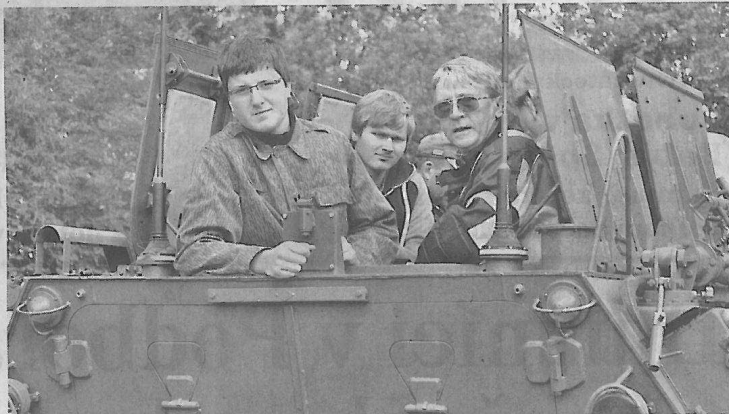
Zámecce vozil obrněný transportér.