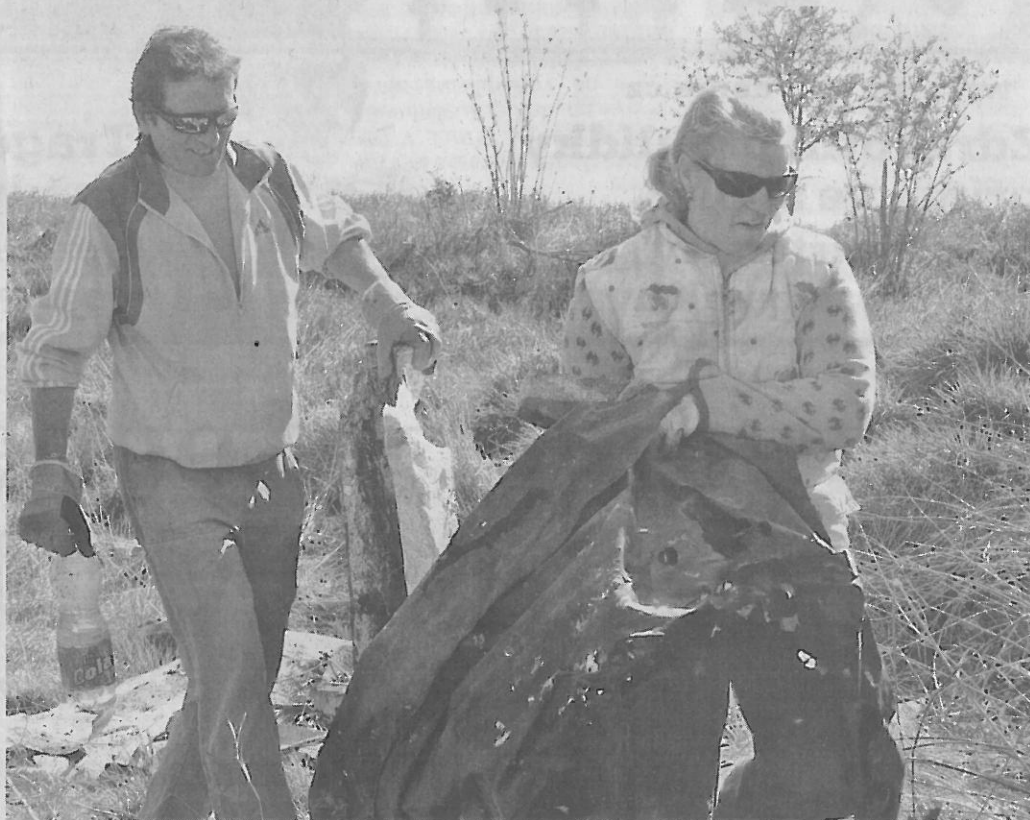
Dobrovolníci pracují ve Skupicích za nedělního slunce.

Úklid technicky zabezpečilo město Postoloprty přistavením kontejneru a dodáním pytlů na odpad. A že odpadu nebylo málo! Dobrovolníci nasbírali vše možné od plastových lahví přes lina, pneumatiky, polystyreny, staré lednice, obrazovky až po plastové součásti aut. Poděkování patří městu Postoloprty a hlavně všem, kteří přišli a s úklidem vydatně pomohli. Ukázali, že jim záleží na prostředí, kde žijí. Děkujeme!