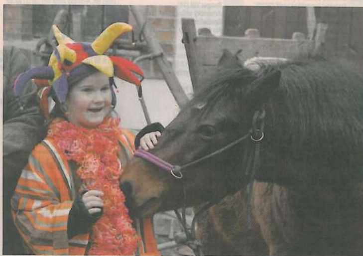
NA DĚTI budou na statku ve Skupicích čekat zvířátka, která si budou moci pohladit – jako při Masopustním veselí 1. března letošního roku.